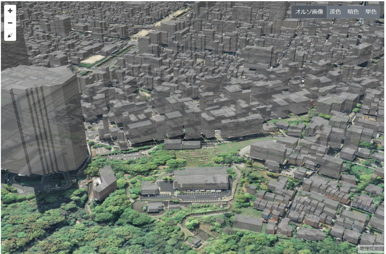
(別紙1-2: デジタルシティサービスのイメージ)